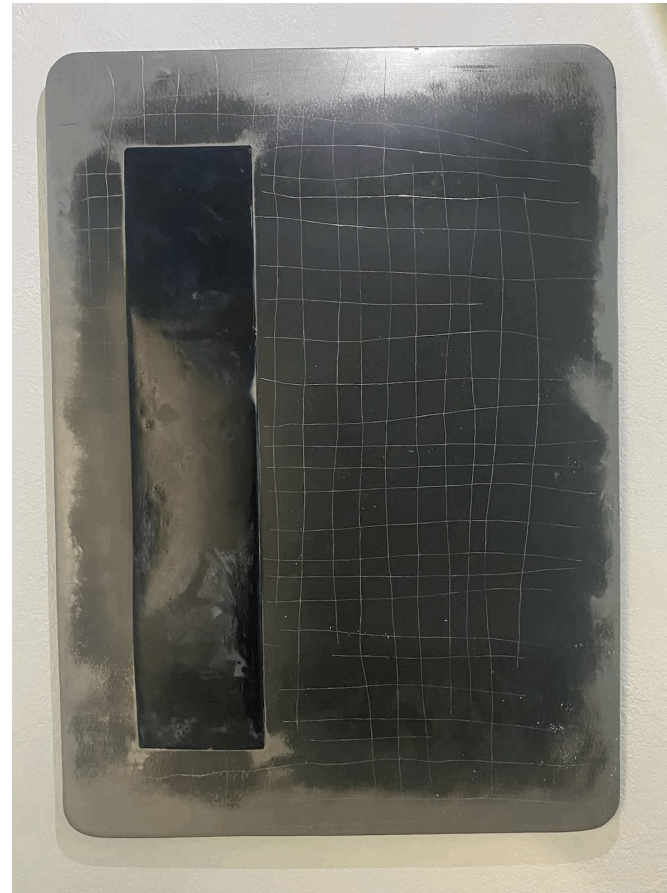
Margot pietri La tête au nord acier verni fibre de verre résine époxy peintures pigments feutres 101,7x72,7x4,5 CM (2022)