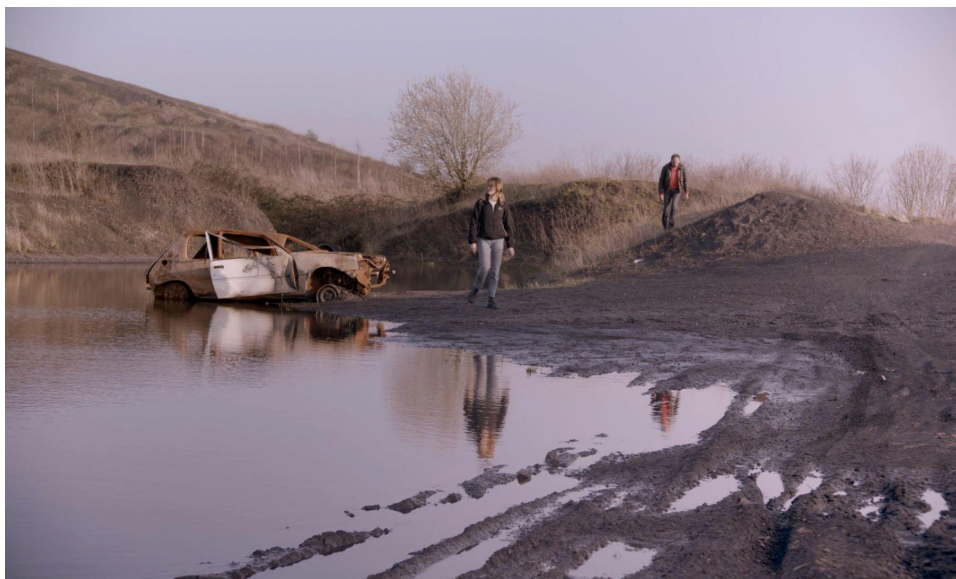
Elsa Brès, LOVE CANAL , Film 18 min, 2017