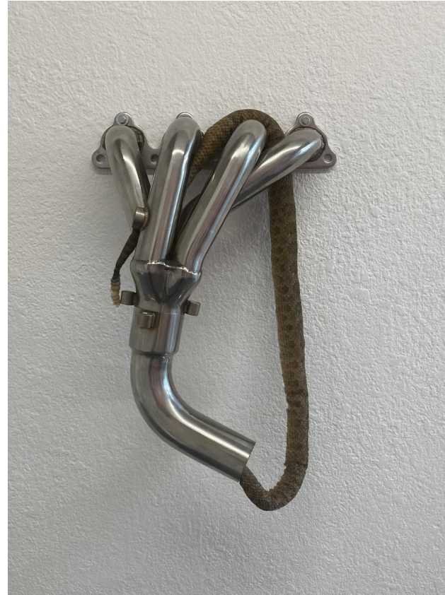
Tyler Eash, Cryptide , Collecteur d'échappement en acier inoxydable peau de serpent à sonnette coton, 2018.