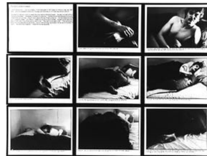
Sophie Calle, Les Dormeurs , Tirages en gélatine argent avec de l'encre et des cadres en métal noir, 6 x 8 CM, 1979