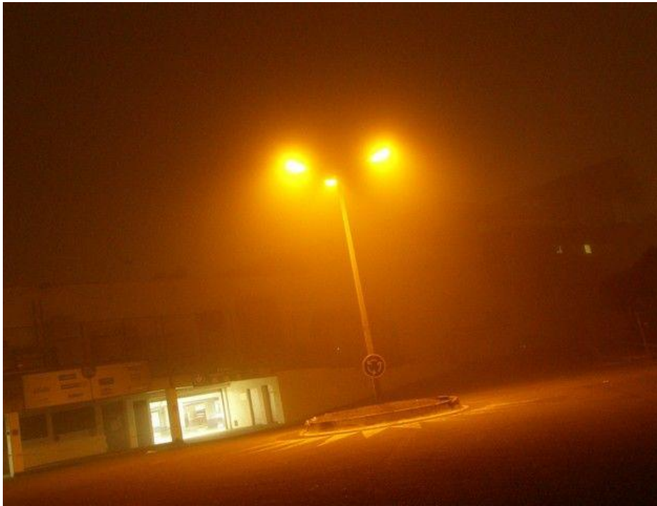
Anaïs-TohéCommaret, Disparaître épisode 1, Film 4 min17s, 2021